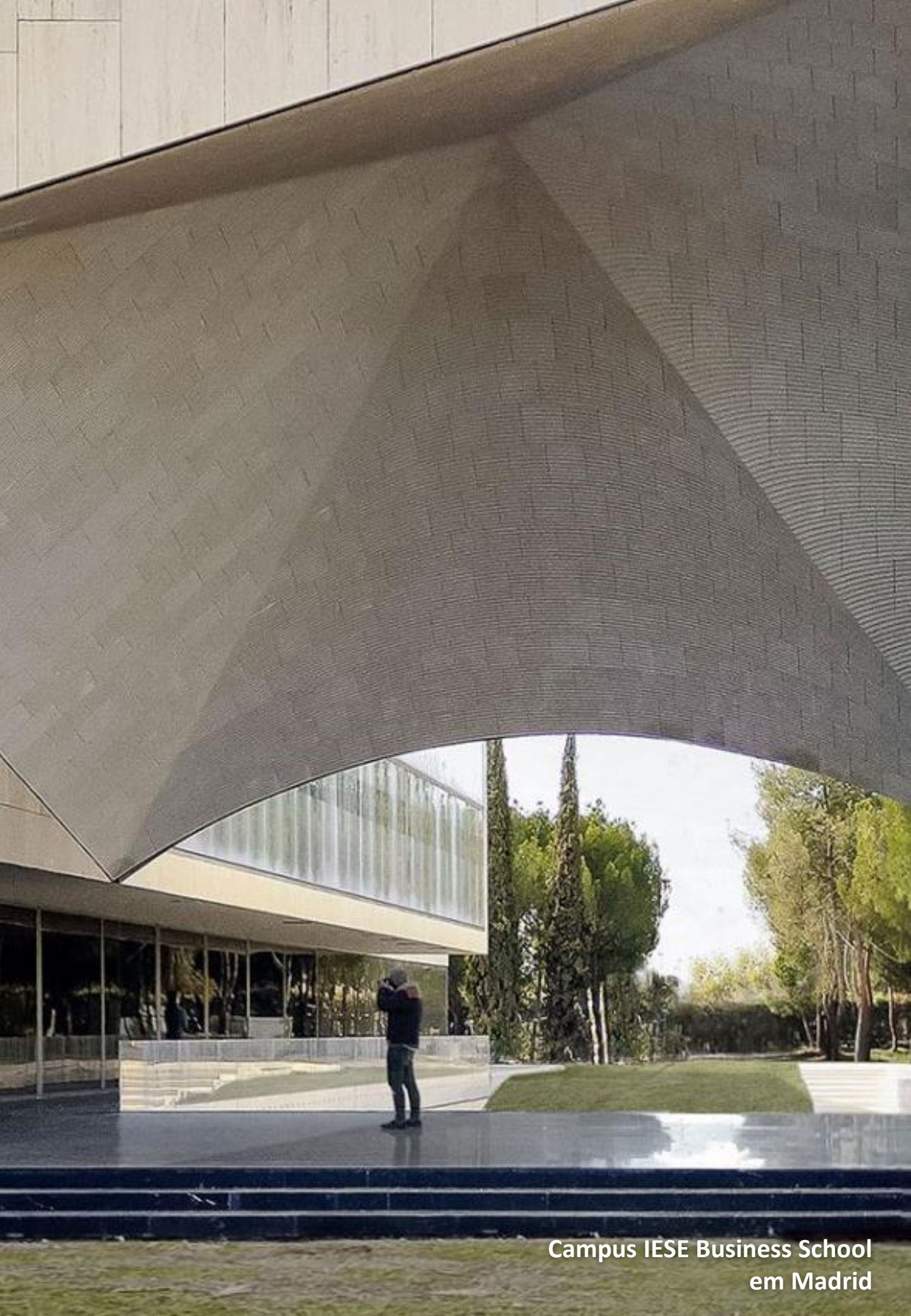
Campus IESE Business School em Madrid