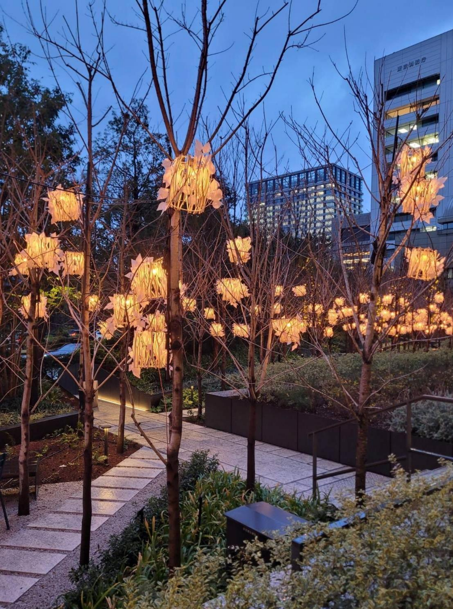
Campus AESE Business School em Lisboa