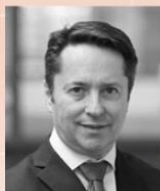
Ignacio Cirac Expert in quantum computation